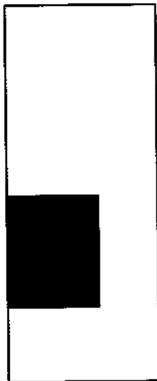
Схема земельного участка по адресу: Самарская область Сергиевский район, с. [REDACTED]